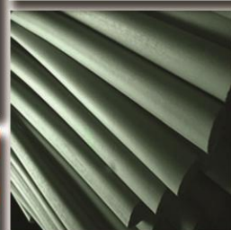
Partian Ladder نردبان پارتیان